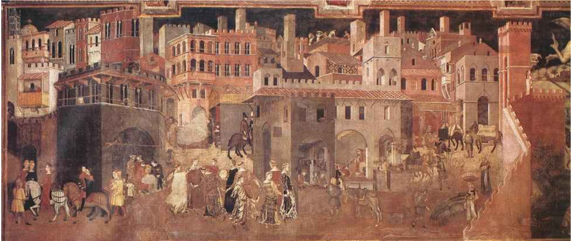
A. Lorenzetti, Allegoria del Buon Governo (1338-1339)